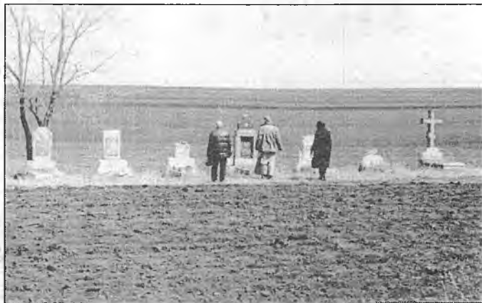
Асколак Расійскай імперыі сярод палёў кітайскага калгаса