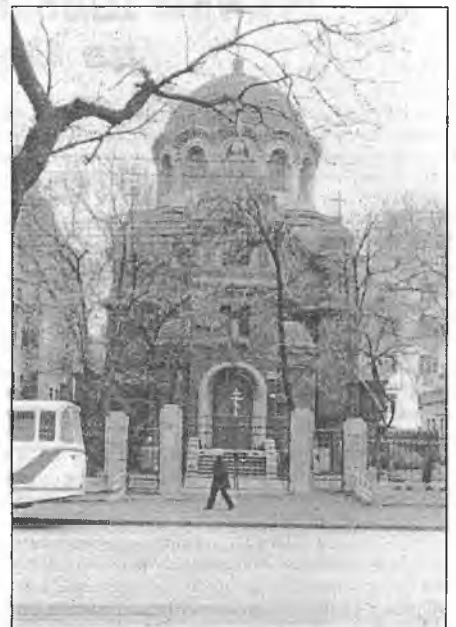
Адзіная з праваслаўных храмаў царква, якая яшчэ дзейнічае ў Харбіне