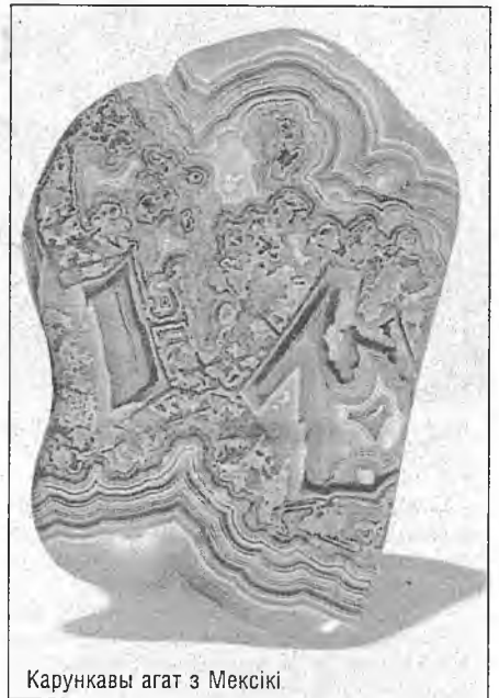
Карункавы агат з Мексікі

што пэўна з'яўляецца іх талісманам. Калі народ "романэ чавэ" сапраўды прыйшоў з Індыі, тады трэба адзначыць, што самыя багатыя россыпныя радовішчы знаходзяцца на пласкагор'і Дэкан. Сустракаецца ён у