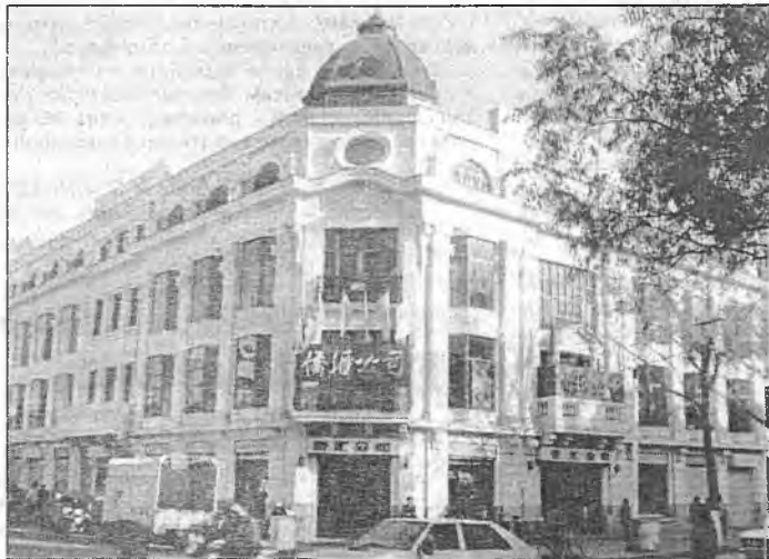
Знакамітая Чурынская крама, дзе калісьці бясплатна давалі чырвоную ікру

— Толькі пасля вялікага скандалу. Я стала даказваць, што, як для кожнага гісторыка, для мяня вялікае значэнне маюць, зразумела, архівы. Даследчыцкую літаратуру адшукаць можна, але архіўныя дакументы — гэта аснова асноў. Я пачала тэлефанаваць у наша пасольства. У выніку, для рашэння гэтага пытання з гарадскімі ўладамі нават прызджаў з Пекіна прадстаўнік пасольства, адказны за стажыроўку. Яны вымушаны былі пусціць мяне ў Харбінскі правінцыйны архіў: гарадскі ў той час быў закрыты на пераезд. У ХПА я работала ў нязручных умовах. Мяне пасадзілі ў нейкі